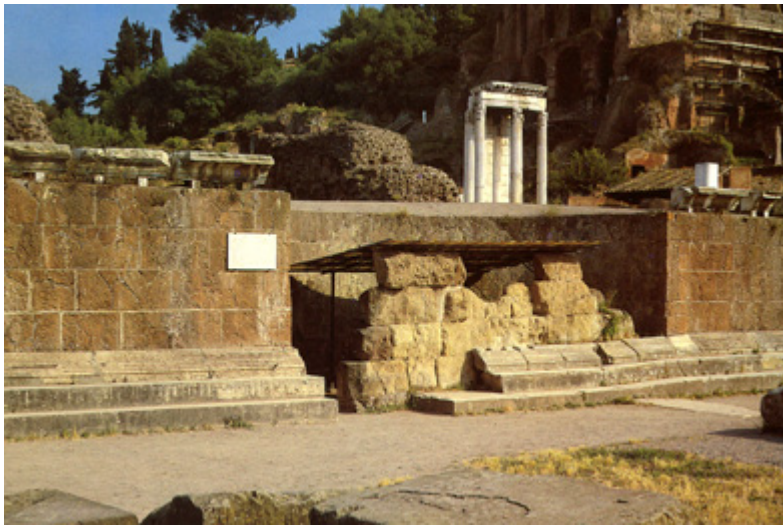
Podiet till det tempel som Augustus lät bygga på Forum Romanum i Rom till minne av Julius Caesar.

Översätt till latin: a) De älskar samma flicka. b) Utan henne kan Marcus inte leva. c) Ni (maskulinum) berömmar er själva. d) Jag ser de där pojkarna. e) Vi kommer till dem. f) Den där tavlan ger jag åt dig. g) Den där mannens tavla är vacker. h) Vi berömmar honom.