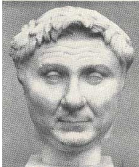
Pompejus. Glyptoteket, Köpenhamn

Gnaeus Pompejus , romersk fältherre och statsman, slog år 71 f. Kr. tillsammans med Crassus ned ett farligt slavuppror, som leddes av gladiatorn Spártacus . Pompejus vann vidare stora militära framgångar i sin kamp mot sjörövarna i Medelhavet, gjorde Syrien och Palestina till en romersk provins och flyttade det romerska rikets östgräns fram till Eufrat. Vid återkomsten till Rom behandlades Pompejus emellertid kallsinnigt av senaten. Den vägrade t.o.m. att infria de löften om jord som han gett sina veteraner. Pompejus slöt sig därför till Gajus Julius Caesar , som hade en stark ställning i det reformvänliga folkpartiet.