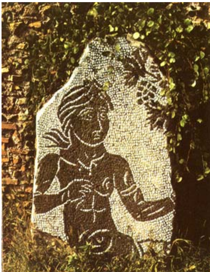
Mosaik med vinskördande amorin i Caracallas termer.