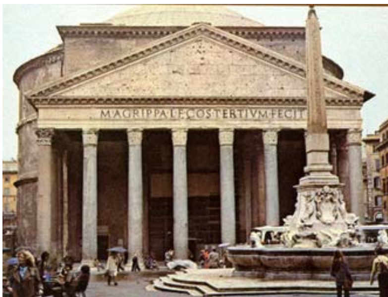
Pantheon med sin kupol - en romersk uppfinning, byggd 126 e.Kr. av kejsar Hadrianus. År 609 e.Kr. omvandlades den till kyrka.