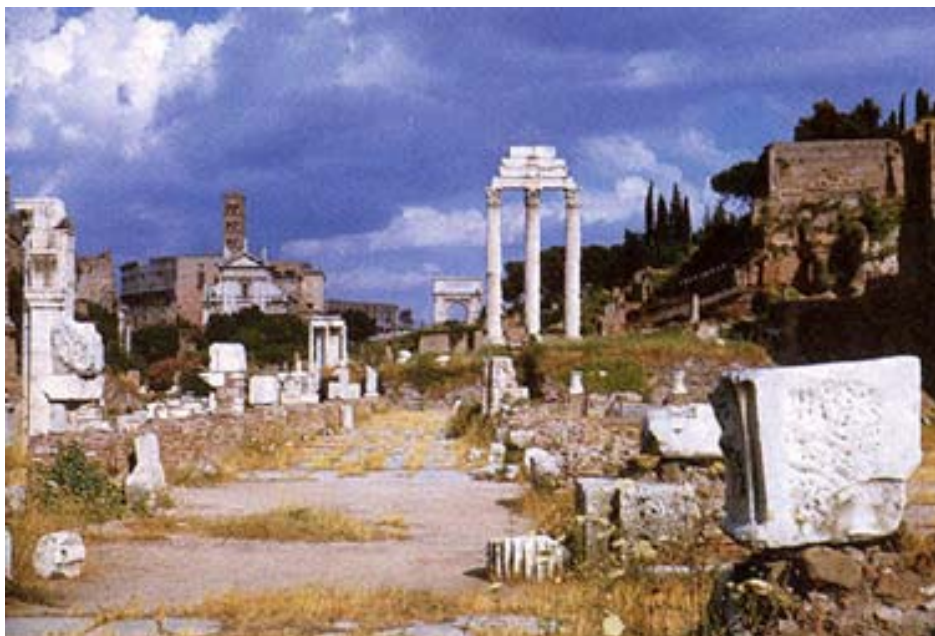
Forum Romanum med Vestatemplet och Castors och Pollux' tempel i mitten och Titusbågen i fonden. Till höger kejsarpalats på Palatinen.

I det gamla Rom var Via Sacra den stora triumfgatan. Här drog triumftågen - det är festtåg på statens bekostnad som beviljats segerrika fältherrar - fram på sin väg upp till Capitolium . Triumftåget gick längs Palatinens södra och östra sidor och vid Colosseum (Amphitheatrum Flavium) gjorde det en tvär sväng i riktning mot Forum för att fortsätta på Via sacra där nu Titusbågen (Arcus Titi) och Septimius Severus' triumfbåge befinner sig.