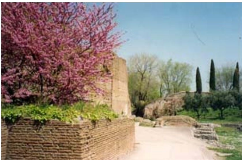
Vy från Palatinen i dag.