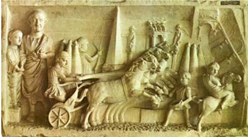
Hästkapplöpningar på Circus Maximus