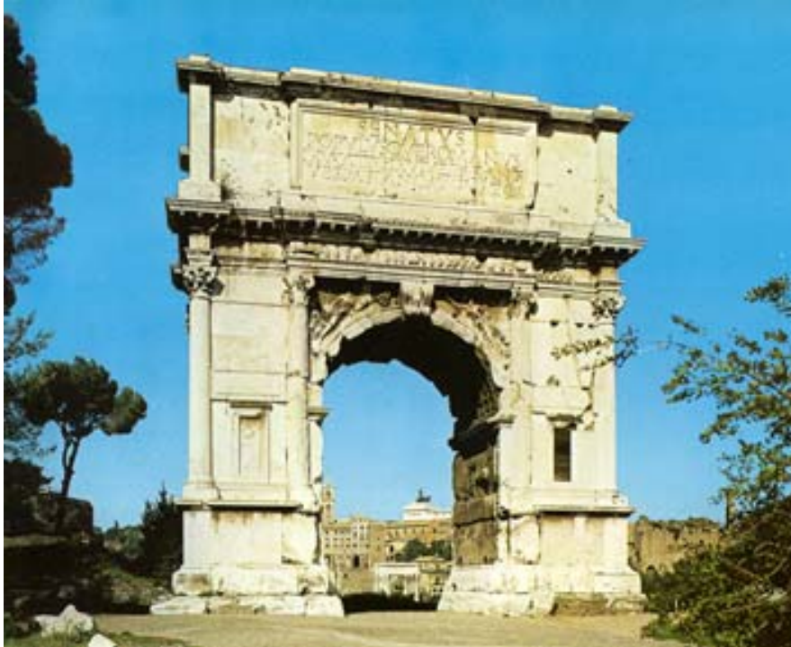
Titusbågen på Via Sacra. Den uppfördes för att fira den romerska erövringen av Jerusalem.