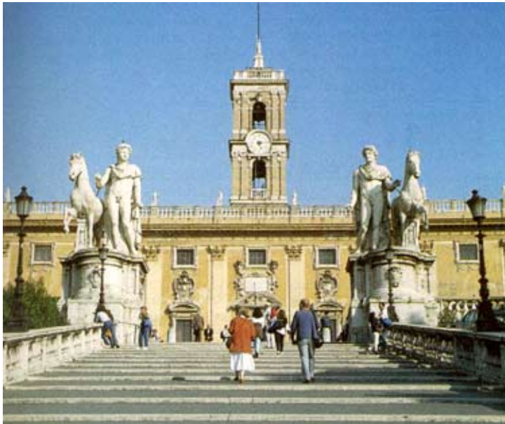
Dagens Capitolium i Rom. De två dioskurerna Castor och Pollux, Zeus' söner, på var sin sida av trappan