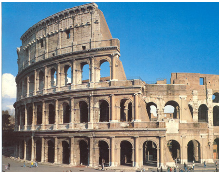
Colosseum i Rom som amfiteatern ser ut idag.