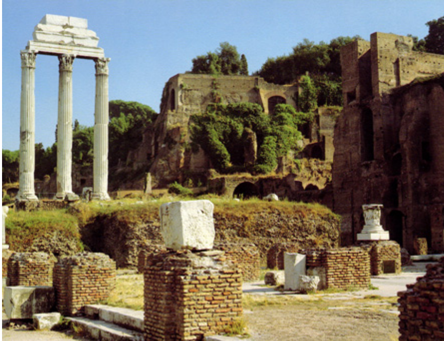
Forum Romanum i Rom. Till vänster står tre pelare av Castor och Polluxtemplet. I förgrunden syns trappavsatsen till Basilica Iulia, till höger delar av kejsarpalatsen på Palatinen.