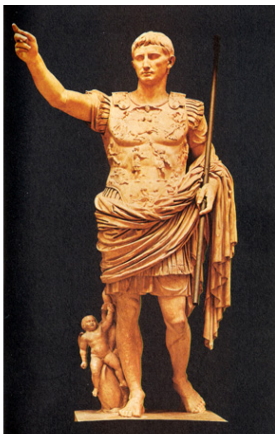
Augustus vid Prima Porta, fångad i talarpose. Vatikanmuseet i Rom.